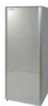
Design tank i.c.m. hydrobox