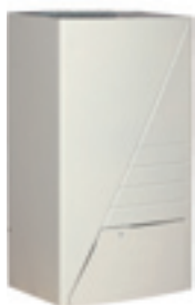
Hydrobox - wandmodel