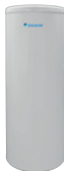
Standaard uitvoering (150/200/300 liter)