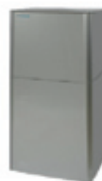
Design tank (200/260 liter)