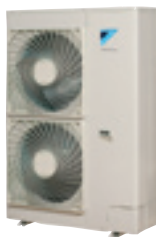
Buitendeel grote capaciteit (11/14/16 kW)