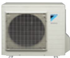
Buitendeel kleine capaciteit (6/7/8 kW)

Het compacte buitendeel is eenvoudig te monteren, zonder boor- en graafwerkzaamheden, en daardoor geschikt voor vrijwel alle typen woningen. Het is beschikbaar in diverse capaciteiten.