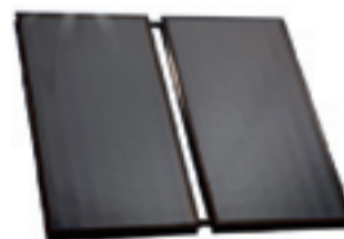
Zonnecollectoren t.b.v. warm tapwater