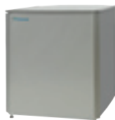
Hydrobox - vloermodel