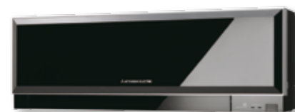
De ZEN-designlijn is verkrijgbaar in 3 kleuren

Mitsubishi Electric heeft lucht-water-warmtepompoplossingen voor warmwater en lagetemperatuurverwarming bij u thuis. Duraklima verkoopt deze duurzame verwarmingssystemen in Nederland onder de naam Ecodan. Meer info over deze oplossingen vindt u op www.duraklima.nl .